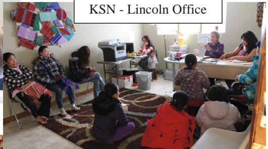
KSN - Lincoln Office