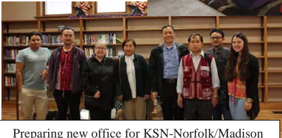
Preparing new office for KSN-Norfolk/Madison