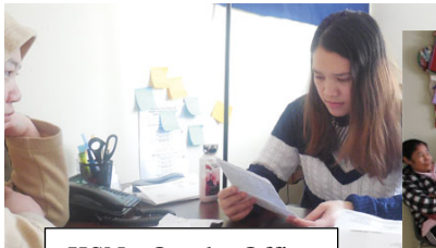
KSN - Omaha Office

1527 S 20th St, #13 LINCOLN, NE, 68502 Phone: 402 261 6614 Email: info@karenksn.org