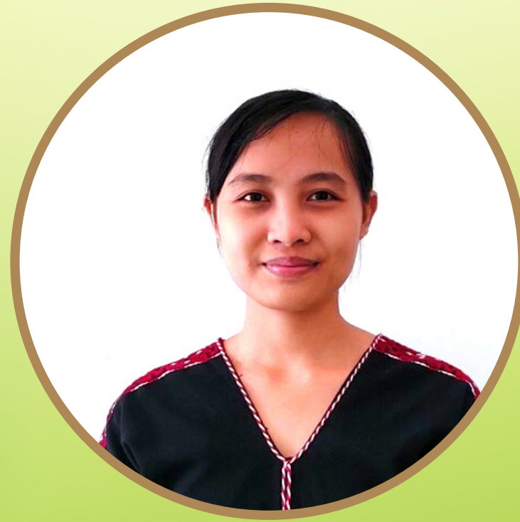
နီၤစရံစမဲဝဲ

ဟံမုၢ်ကရၢတၢ်ကစီၣ်ကြၢးသ့ၣ်ညါ ၂၀၁၂နီၣ်, KKBC