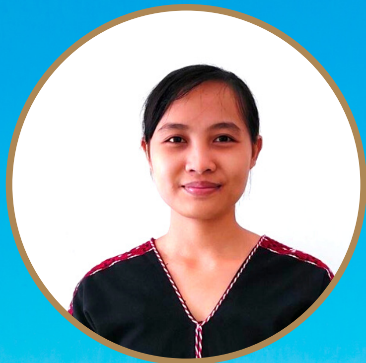
နီၣ်စရံစမဲၣ်

ပုလောအဟ်ထိန်ထီအသးန့ၣ်ကဘၣ်တၢ်ဆိၣ်လီၤ အီၤ, ဒီးပုလောအဆိၣ်လီၤအသးန့ၣ် ကဘၣ်တၢ်ဟ် ထိန်ထီအီၤလီၤ.